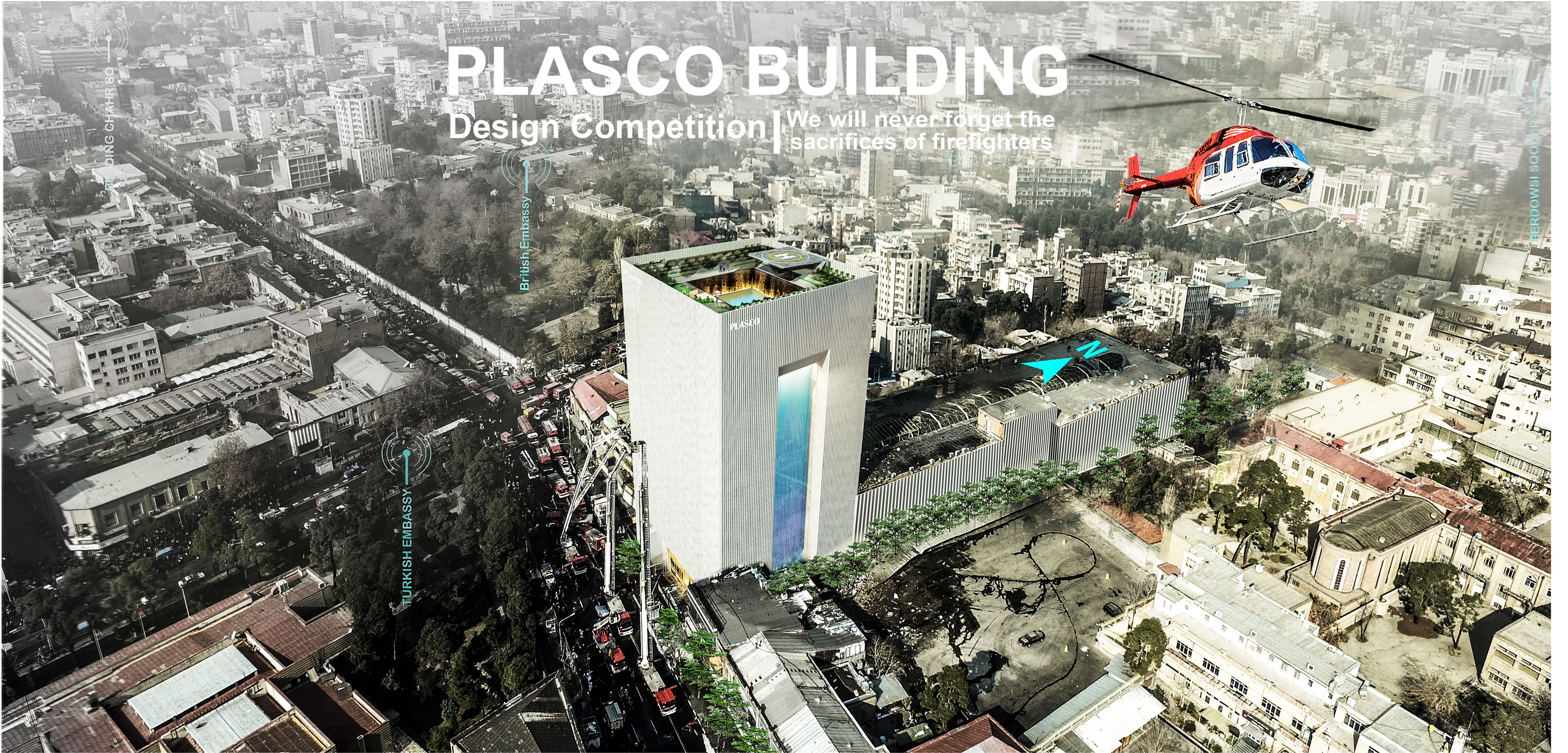
→ Logo Export the main form Concept Diagram